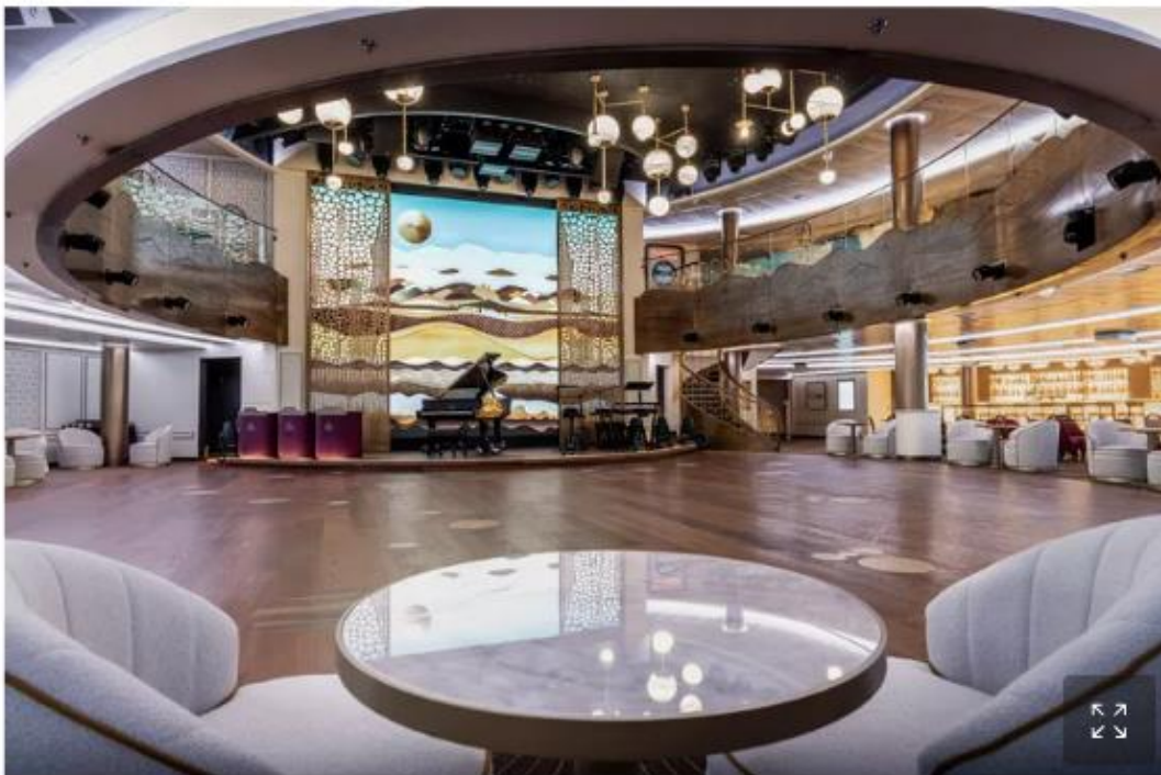
Le Queen Anne abrite notamment un théâtre de 800 places.

Avec notamment 15 espaces de restauration (certains en extra), salons, bars et discothèques, son théâtre de 800 places, ses 3 piscines extérieures et 7 jacuzzis, son spa, ses salles de sport, son court de tennis paddle ou sa piste de jogging extérieur, Queen Anne offre toutes les prestations attendues sur une transatlantique . Sans oublier ses boutiques de luxe, avec des montres à plus de 11.000 dollars, une galerie d'art (mais là, c'est affaire de goût !), un casino ou encore des espaces réservés aux enfants. Des services religieux, voire des cérémonies de mariage sont également proposés.