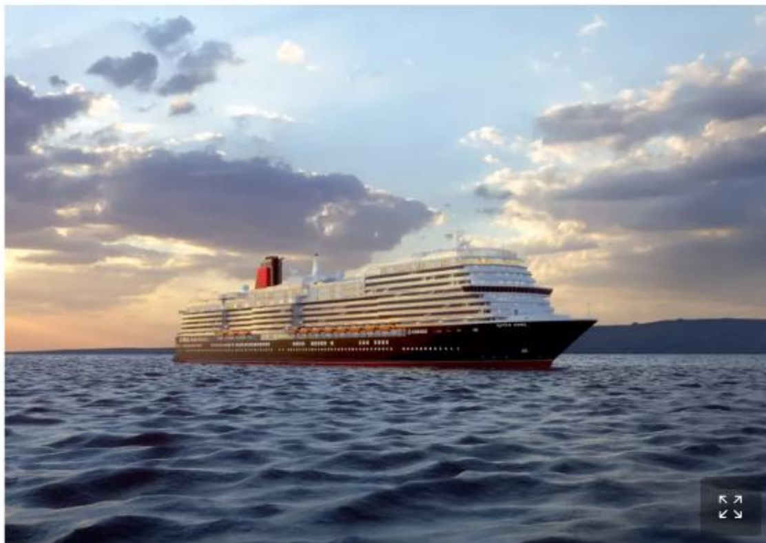
Malgré ses 14 ponts passagers et ses 322 mètres de longueur, le Queen Anne arbore l'allure affûtée de ses aînées, les « trois Queens » ( Mary 2, Victoria et Elizabeth ).